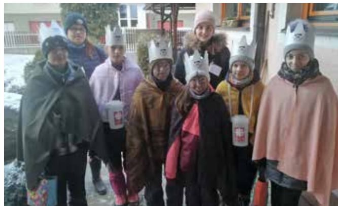
Tři králové v Zahrádkách