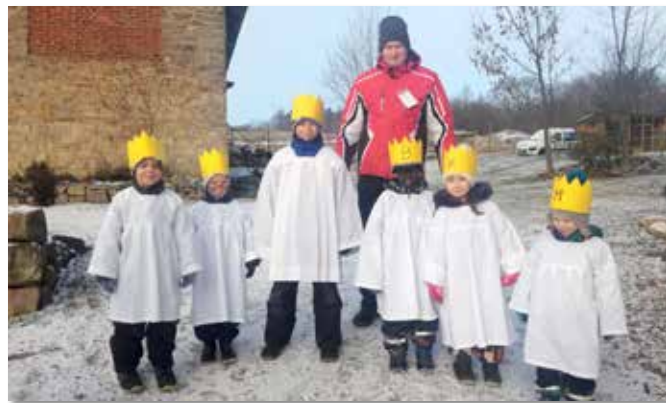
Tři králové v Horních Dvorcích