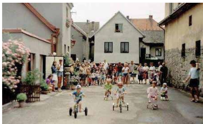
Otevření zahrádecké poštovny 16. 7. 1995

kdež předváděn byl válečný nálet na město a obrana obyvatelstva proti náletům. Dne 6. března 1937 večer byla konána slavnostní vatra na vrchu Šafrancí na počest 87. narozenin pana prezidenta Osloboditele Tomáše G. Masaryka. Ačkoli bylo špatné počasí, zúčastnila se této oslavy skoro celá obec.