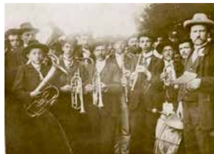
Muzikanti v době 1. světové války