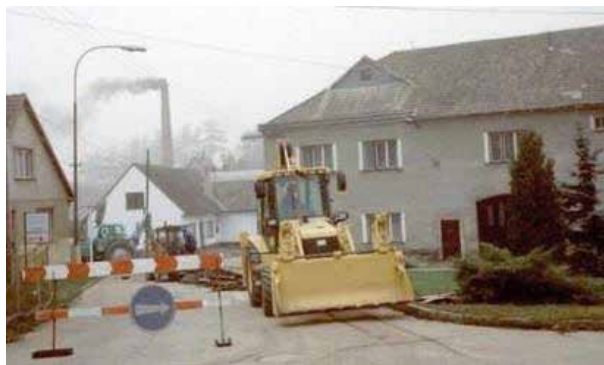
Plynořkace obce před zimou 1996