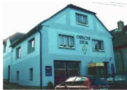
Podoba budovy obecního úřadu z roku 2006

nebo pracovali jako úředníci či pletaři.