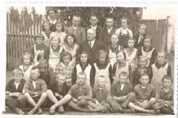
Zahrádecká škola 28. 9. 1935

polní práce se zdržovaly. Půda byla tak nasáklá, že už další vodu nepřijímala a na místě bývalého rybníku Korytníku, kde byla toho času úrodná louka, se znovu začal rybník tvořit. V polovině června se počasí najednou otočilo, bylo slunce a teplo, na konci června + 30 °C. Ale pak se voda vrátila a našly povodně na Slovensku i v Čechách. V Korytníku střídavě rostla tráva