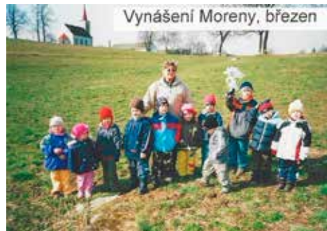
Mateřská škola Zahrádky v roce 2007