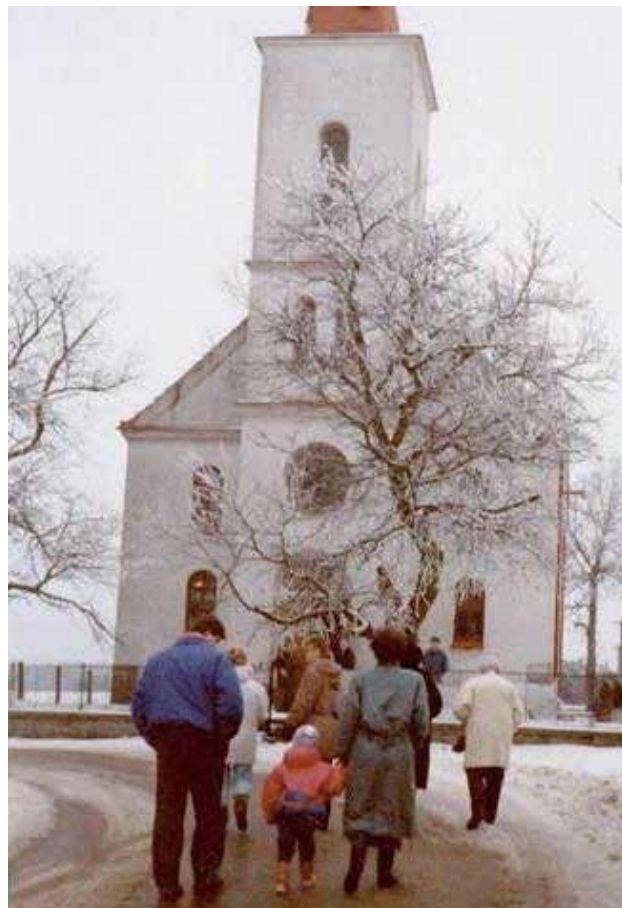
Adventní koncert v roce 1995