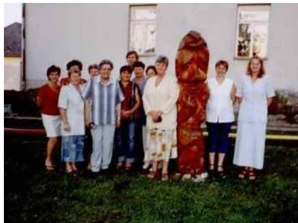
Oslavy 25 let Mateřské školy Zahrádky v roce 2005

bez problémů a účast byla sto procentní. Zvolen do čela MNV byl soudruh Kremlička. (Zatímco voličům uměla vláda poručit, větru a dešti ne – pozn. redakce). V neděli 5. června 1960 postihlo naši obec krupobití. Po obědě se přihnala bouře s kroupami, které citelně ničily mladou úrodu. Také mladé ovocné plody, jichž byl ten rok dostatek, byly zasaženy