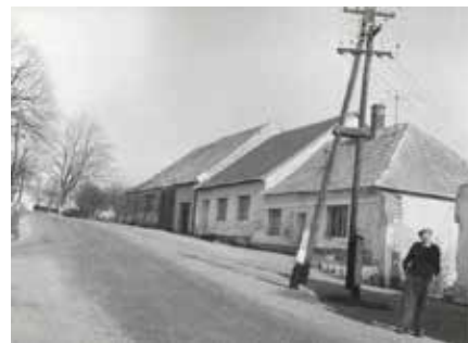
Horní Dvorce kolem roku 1965