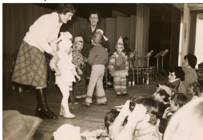
Vystoupení dětí z MŠ na dětském karnevale