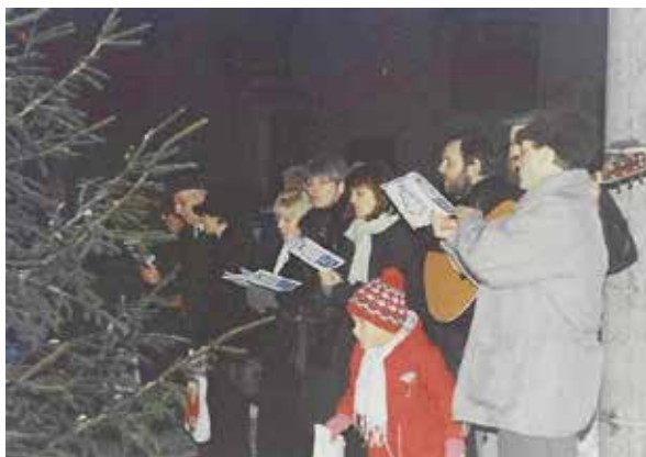
Rozsvícení vánočního stromu v roce 1995

vzpomínku stojí také zaniklá mariánská kaplička, která stála před obecní kanceláří. Tato drobná perla barokního umění byla postavena roku 1802 a zanikla v roce 1950.