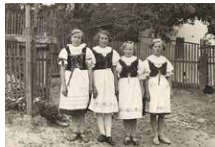
Minule jsme otiskli fotku chlapců, dnes tu máme dívky. Fotografie vznikla kolem roku 1940. Poznáte někdo svoji babičku/maminku/tetičku?