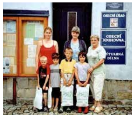
Rozloučení s prvňáčky z MŠ Zahrádky v roce 2005.

republiku ze všech stran. Ten den bylo hodně sněhu a chumelilo. Přes Zahrádky žádná vojska neprojela, byl klid, jako by se nic nedělo. Ochotníci hasičského sboru sehráli v dubnu dvě představení. Vzhledem k novému způsobu jízdy vpravo bylo nařízeno, aby všichni majitelé tažných vozů přendali brzdy na pravou stranu. Vozkové si na tuto novotu nemohli zvyknout. Vzhledem k mimořádným poměrům se lidé zásobili různým zbožím. Nejvíce šly na dračku boty, na ně se čekalo i několik týdnů. Nezaměstnanost téměř nebyla, nejistota nutila lidi investovat do svého majetku. Práce na stavbě katolické kaple pokročily tak daleko, že se pomýšlelo na její posvěcení toho roku. Bylo však