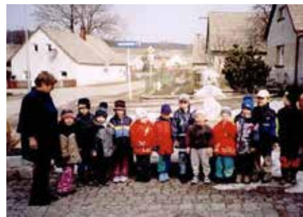
Vynášení Morany v roce 2004

a aparát pracoval rychleji, takže už dělníci nemuseli chodit do práce před čtvrtou ráno, ale až na sedmou hodinu. Obecní rozpočet za předešlý rok skončil se schodkem 6 550 Kč a zastupitelstvo tak rozhodlo o navýšení daní o 250 %, což schodek mělo pokrýt.