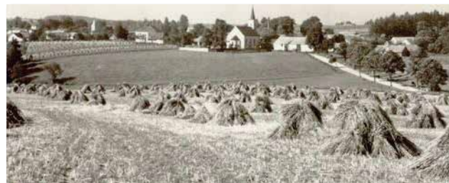
Pohlednice z pole kolem roku 1950