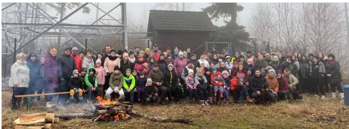
Výstup na Mackův kopec