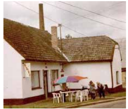
Bistro U křížku, léto 1996

těžké zemědělské techniky, proto se začaly cesty postupně opravovat a zpevňovat. Opravil se byt pro ředitele školy v budově místní školy. A když nastoupil nový ředitel Valenta v roce 1960, pustil se do úprav školní zahrady. Opravil také plot, a tak už do zahrady nelezly slepice.