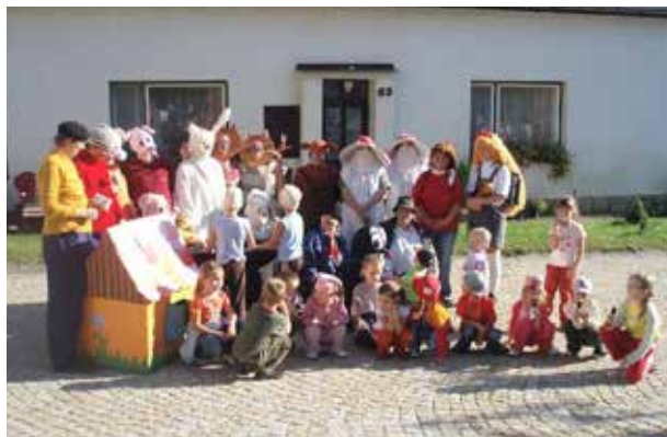
Pohádkový les v roce 2007